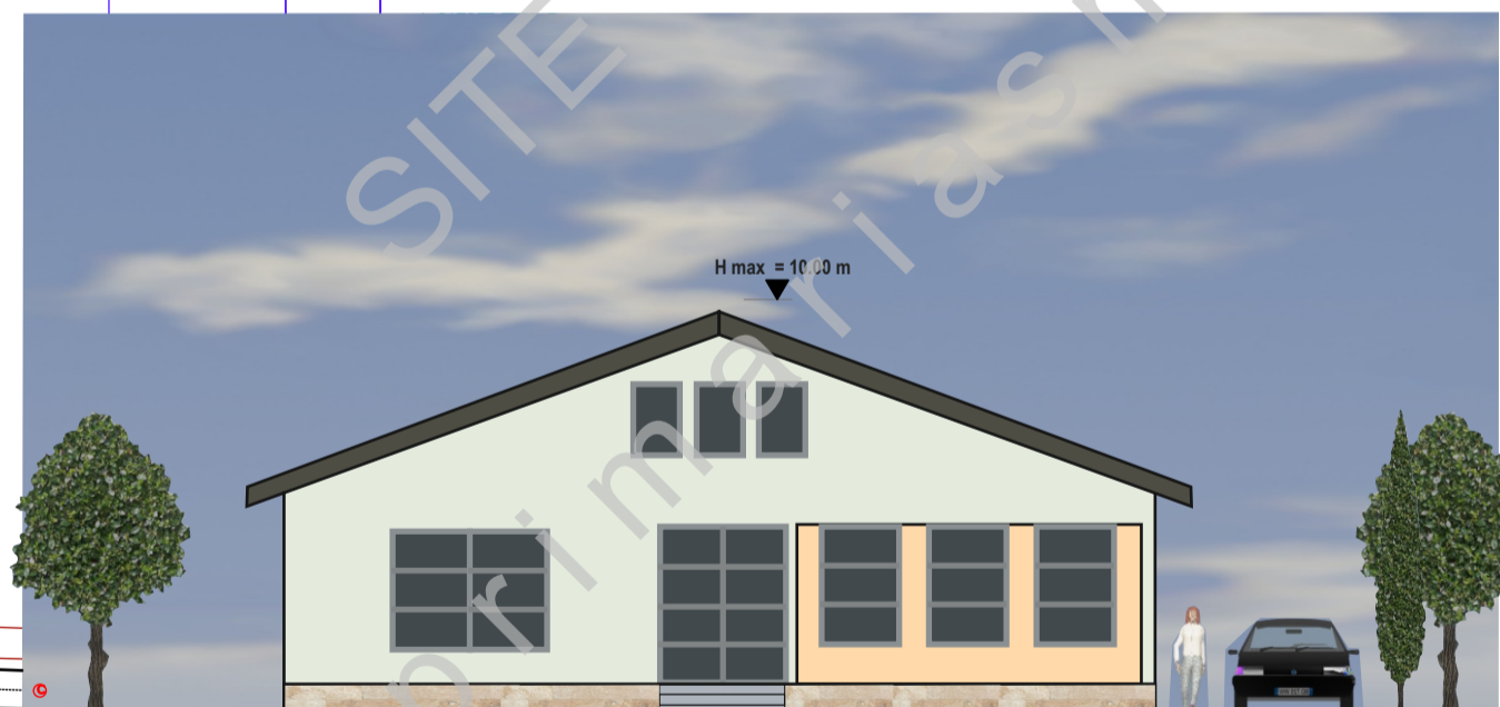
VEDERE STR. CURTUIUS 1