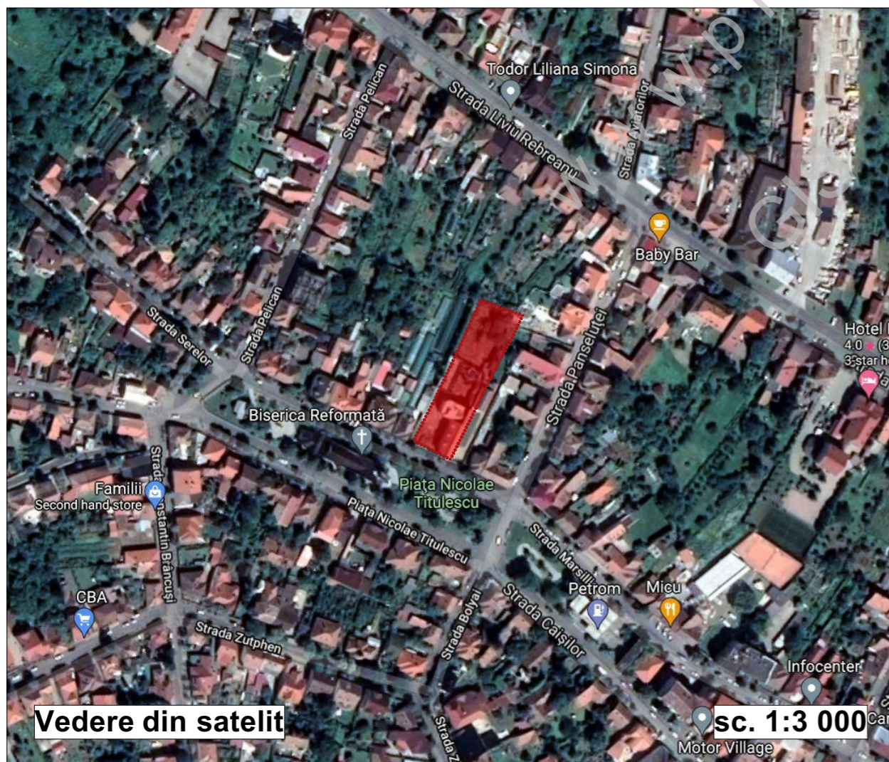
Vedere din satelit