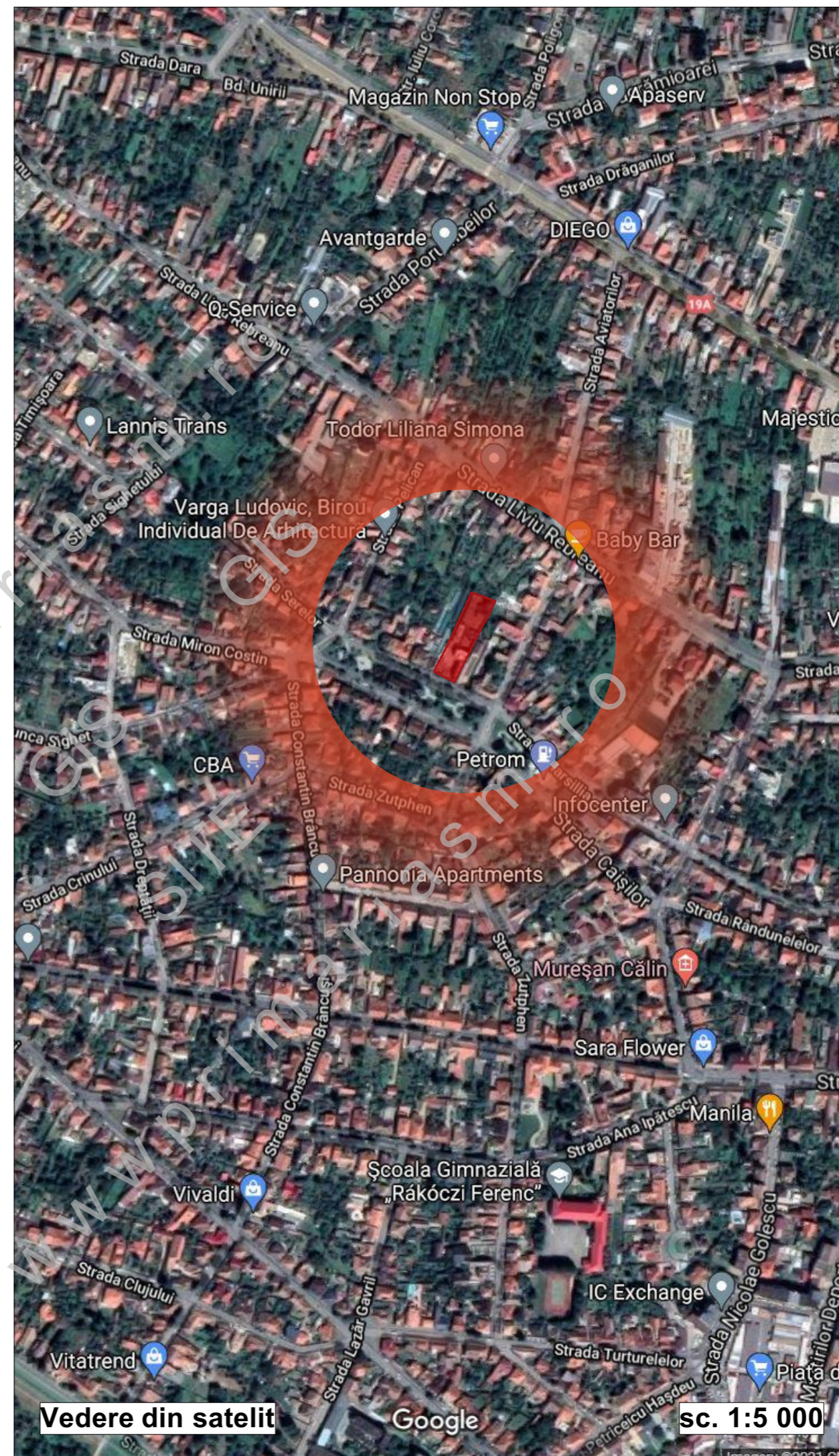
Vedere din satelit